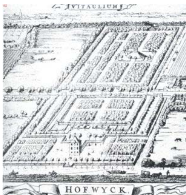
Zie kaartje punt C.

Naast secretaris van de Prinsen van Oranje Frederik Hendrik en Willem I was hij dichter, componist, kustkenner én vader van Constatijn en Christiaan Huygens . Het huis en de bijbehorende tuin zijn symmetrisch gebouwd. De verhoudingen tussen de afmetingen zijn hierbij zeer bewust gekozen. De tuin was namelijk gebaseerd op het menselijk lichaam, waarbij het huis het hoofd vormde met de vensters als oren, neusgaten en ogen. Na de dood van zijn vader Christiaan Huygens heeft nog lange tijd in het huis gewoond. Het huis is in 1849 geveild en voor afbraak gered door Guillaume Groen van Prinsterer een protestants-christelijke politicus die streed tegen ongelof en revolutie.