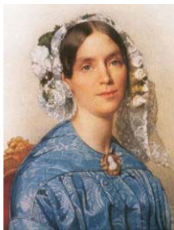
Zie kaartje punt A.

De Wijkerbrug behoort samen met de Kerkbrug, de Nieuwe Tolbrug en de sluizen tot de waterbouwwerken die tussen 1887 en 1894 zijn verbouwd in het kader van de schaalvergroting van de scheepvaart.